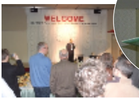
オープニングレセプション

ISO/TC211では、春と秋に行われる総会で作業状況報告や今後の運営方針等を決議しています。なお、国土地理院においても、第1回総会から職員を派遣しています。